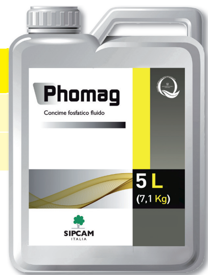
CONFEZIONE 5L (x 4)